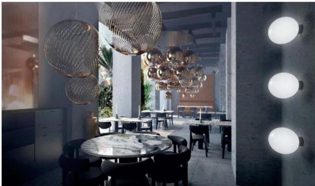
IMAGEN: CORTESÍA TOM DIXON

El corazón de Milán se prepara para darte la bienvenida a THE MANZONI , el primer restaurante de TOM DIXON . Los visitantes tendrán una experiencia de primer nivel con los productos de la marca en un contexto activo, el mobiliario incluirá colecciones como las sillas Fat, las lámparas Spring y las luminarias Opal. El diseñador inglés prepara la preapertura a inicios de abril para coincidir con el Salone del Mobile y posterior a éste realizar una reapertura.